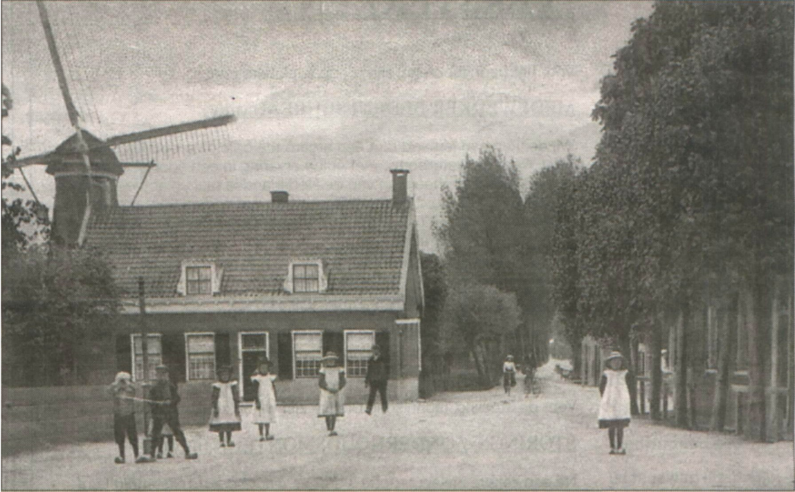
Blik op de dorpstraat en de molen rond 1913

Arnoldus en zijn vrouw Goudina Zwamborn krijgen 18 kinderen, waarvan 2 zoons het bedrijf uiteindelijk overnemen. De gebroeders van Vliet plaatsen in 1904 een petroleummotor en de molen wordt nauwelijks meer gebruikt om te malen.