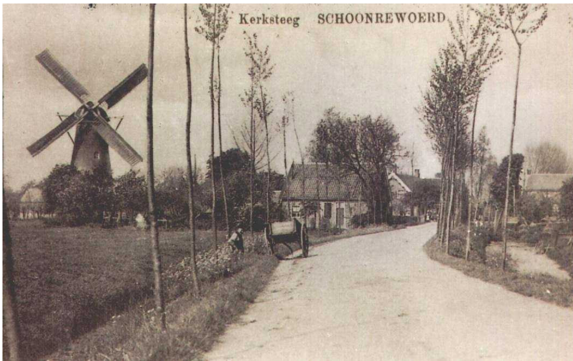
De molen gezien vanaf de Kerksteeg.